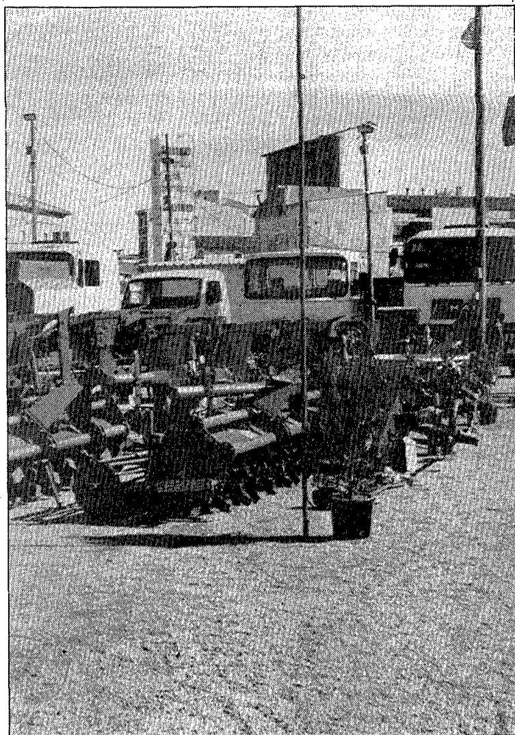
La maquinària agrícola és un sector important de la fira de St. Lluç.

A la una del migdia, al recinte firal, se celebrarà el lliurament dels premis al millor bestiar i ramaderies