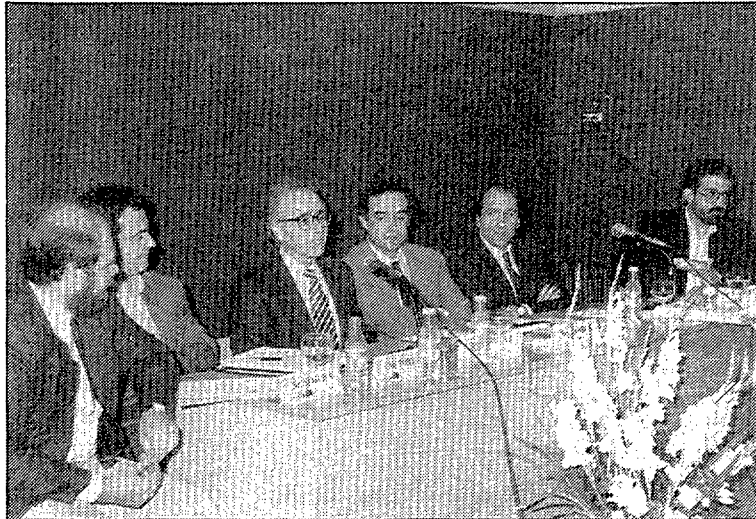
La mesa redonda fue el tema central de la última sesión de las jornadas.