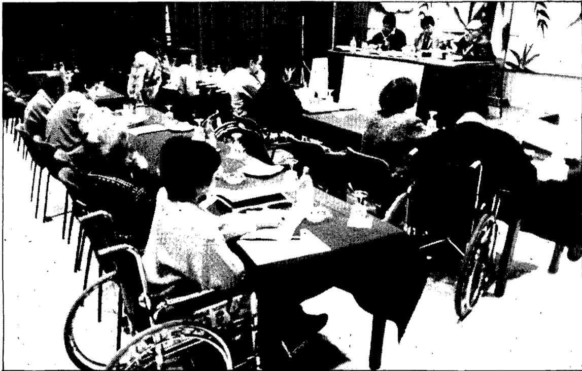
Un moment de les jornades sobre l'associacionisme dels minusvàlids celebrades aquest cap de setmana a Lloret de Mar. (Foto DAVID QUINTANA).

D'altra banda, les associacions de minusvàlids pressionaran el Govern central i els autònoms perquè actuïn en el servei públic, transports i barreres arquitectòniques, i que estableixin una llei en aquest sentit. Així, pretenen que s'adeqüin els autobusos en les ciutats grans i que es destinin taxis als minusvàlids a les petites, i que els edificis disposin de sistemes per facilitar l'accés