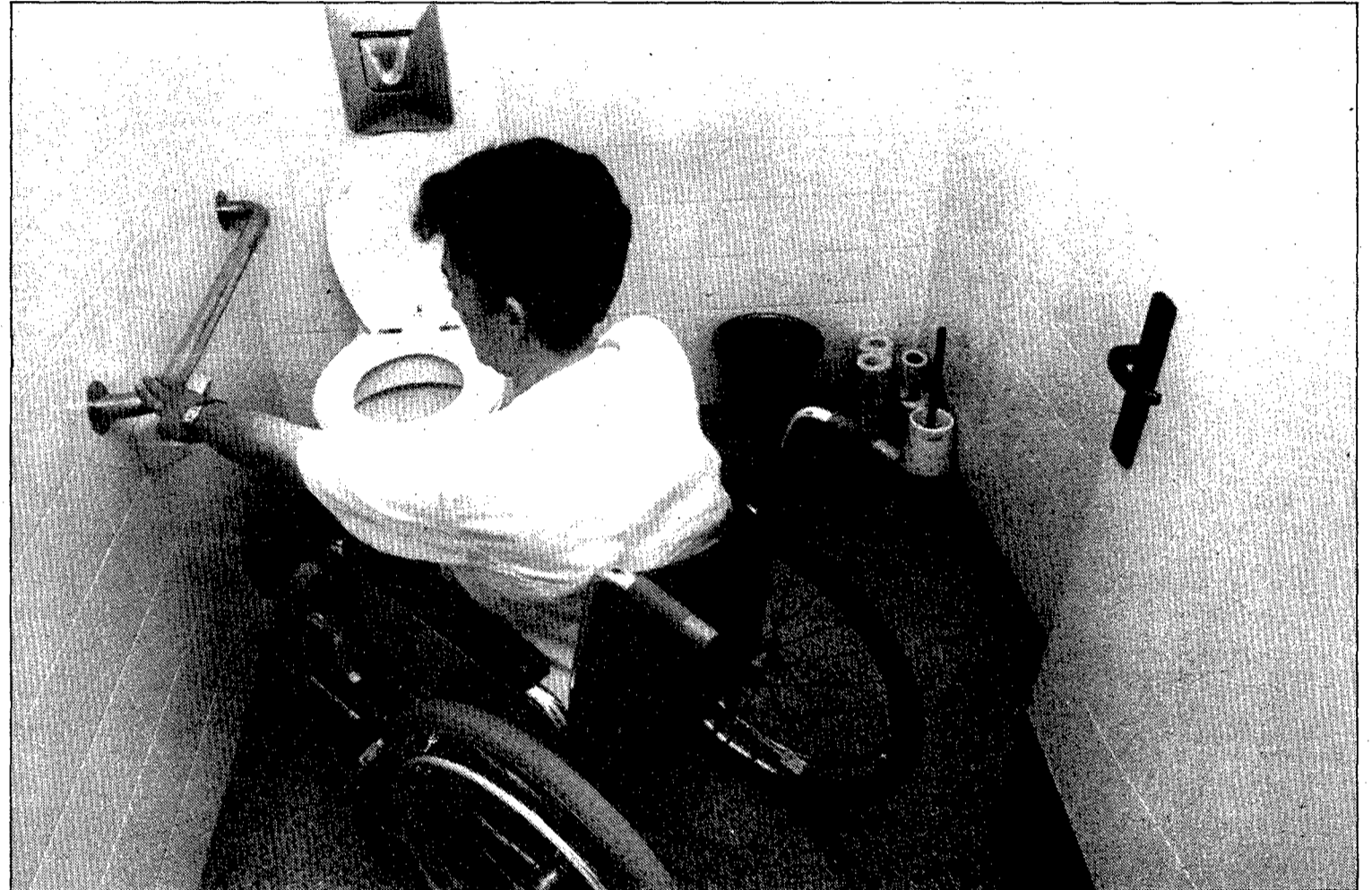
Els accessos i les dependències de l'ICASS estan adaptats a la normativa sobre la supressió de barreres arquitectòniques. A la foto, els lavabos de l'oficina.