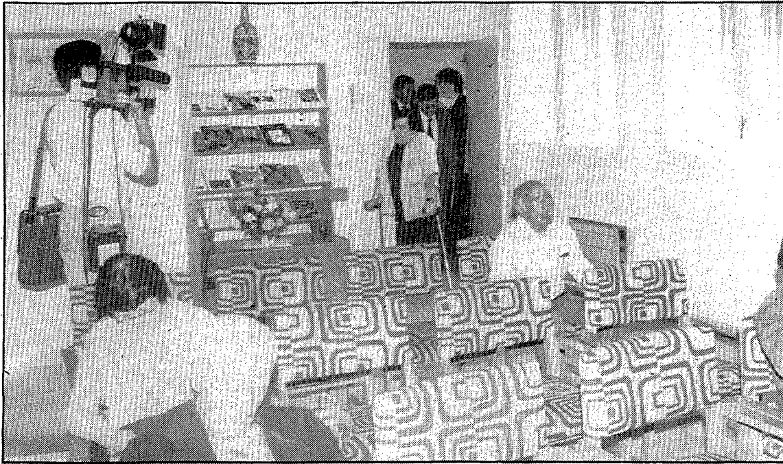
Un moment del judici que es va haver de celebrar al casal d'avis d'Olot, a causa de les barreres arquitectòniques que hi ha a l'edifici dels jutjats.