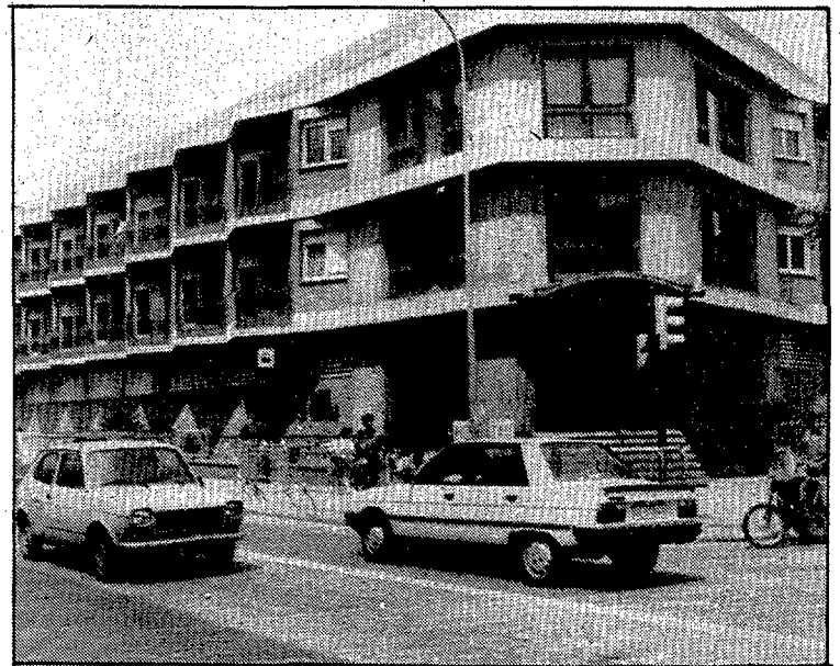
Els responsables de l'Hospital d'Olot han afirmat que la contractació d'una nova infermera ha beneficiat l'assistència mèdica del centre.

d'una nova professional d'infermeria per raons de necessitat de l'Hospital». És en aquest aspecte que matisa el comunicat, «molt especialment», que l'esposa d'un metge fou contractada com a infermera ocupant una plaça de treball que havia estat anteriorment sol·licitada per altres membres del personal del departament, la qual cosa motivà la protesta pública de tot el col·lectiu. La direcció acaba el comunicat considerant que dita contractació ha beneficiat l'assistència mèdica i remarca que els criteris són els definits anteriorment.