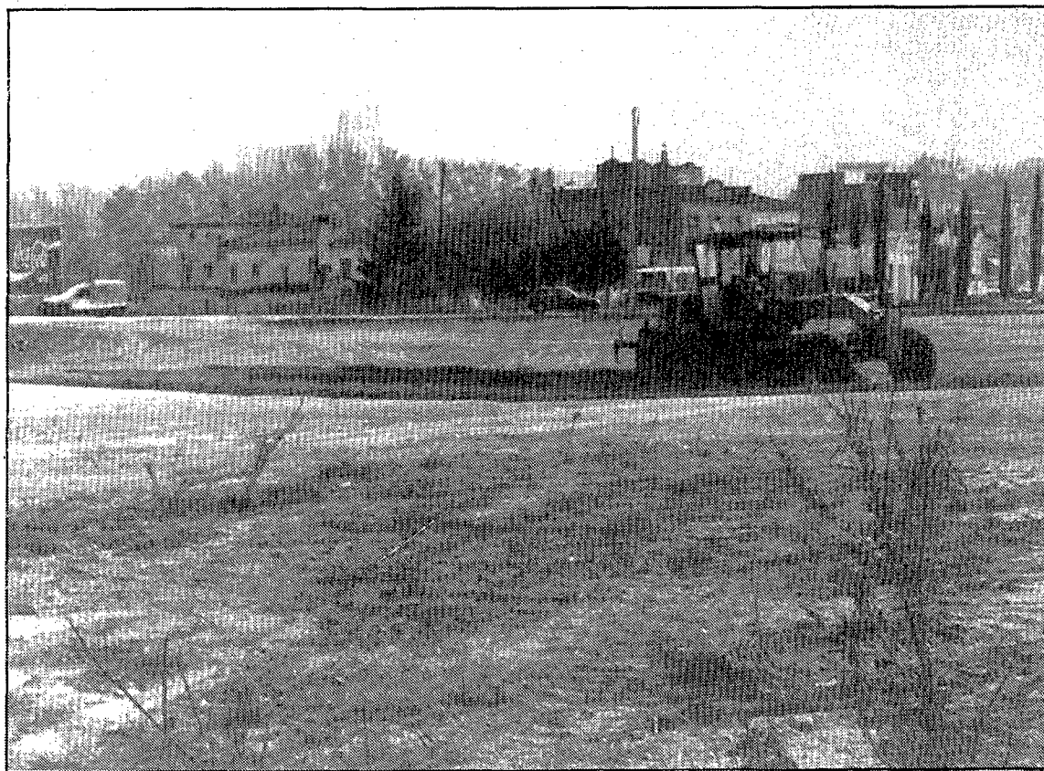
En Fontejau se ha habilitado un parking con capacidad para cien vehículos.