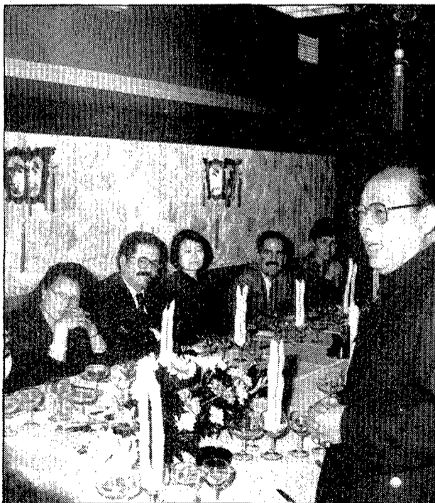
El cònsol xinès, amb altres convidats, durant el sopar d'inauguració.