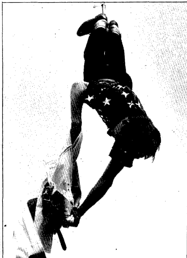
Un màgic realitzant un exercici durant la trobada de l'any passat.