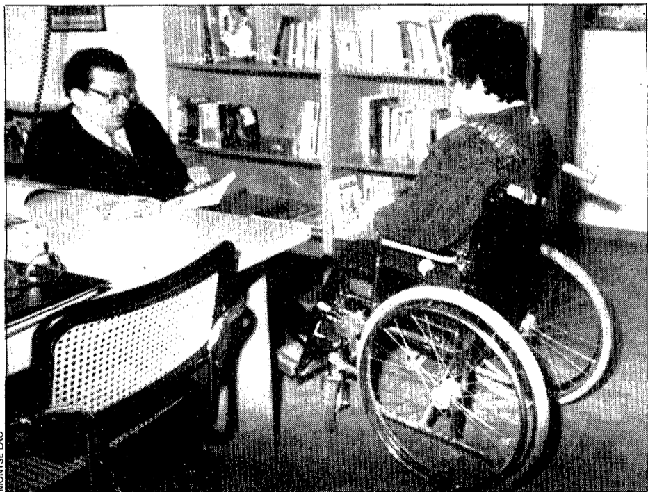
Aspecte d'una de les sales de la nova residència.