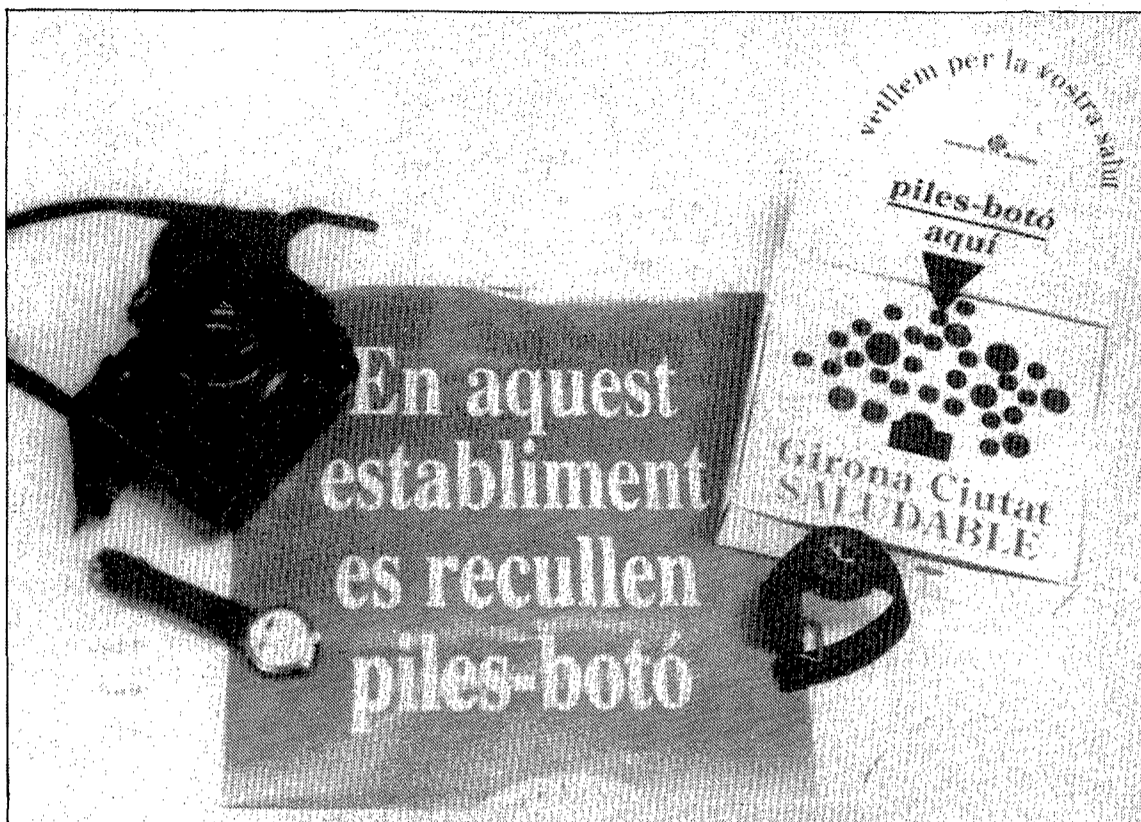
En aquesta capsa s'hauran de dipositar les piles una vegada utilitzades. (Foto RICARD CAMÓ).