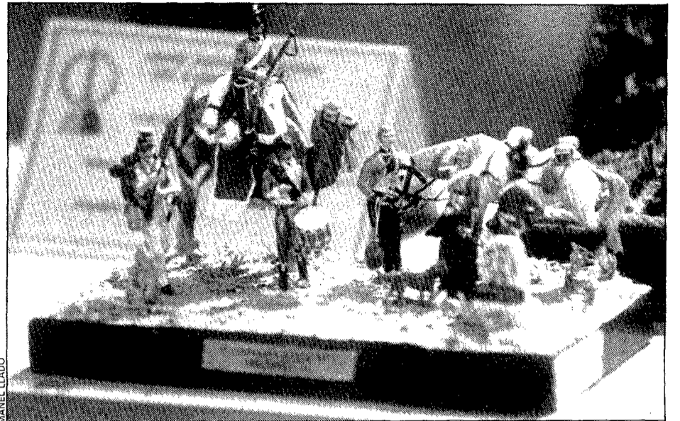
A l'exposició —la fotografia en recull una part— hi ha més de tres mil figures.

Entre les miniatures exposades, les més antigues daten de l'any 1860, que van