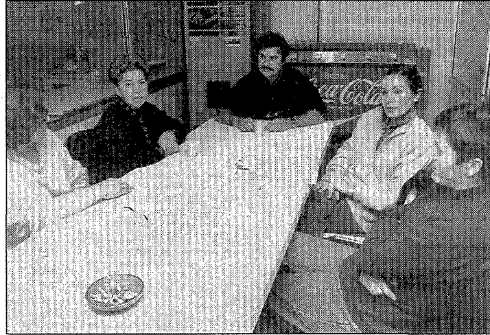
Els treballadors, informant sobre la seva plataforma. (Foto JORDI PICAZO).

- Un plus del dos per cent del salari, per a aquells treballadors que efectuen la seva jornada laboral diària en tres o més centres.