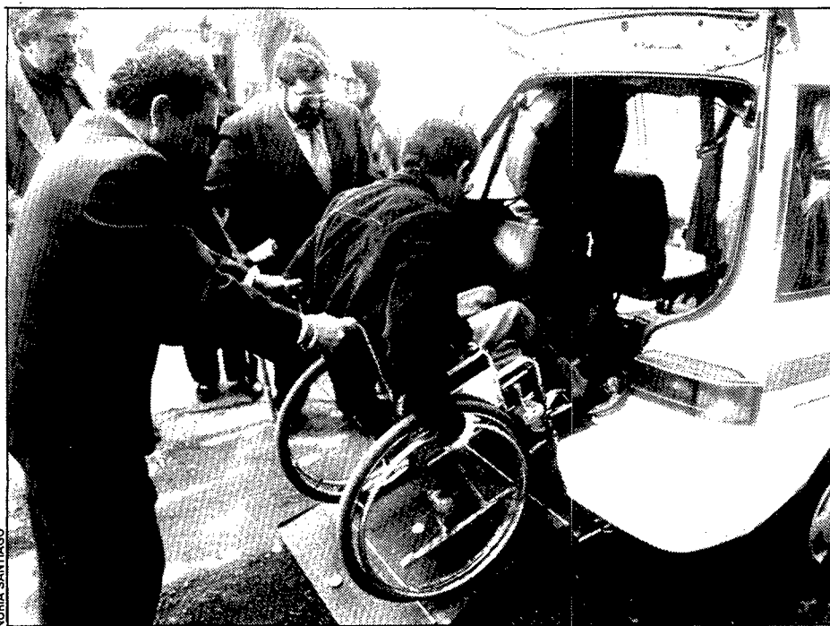
Un disminuït físic va estrenar ahir mateix el primer taxi polivalent.

que pot utilitzar-se també per al servei normal de viatgers amb tres places lliures al darrere i una al davant. El vehicle està connectat a Ràdio Taxi de Girona, de manera que pot rebre trucades des de qualsevol lloc de la ciutat i comarques. El cotxe és de la casa Nissan i ha costat quatre milions de pessetes, que han sufragat a parts iguals el taxista que s'ha quedat la llicència i les associacions Mifas i ONCE, l'Inserio i la Federació de Municipis.