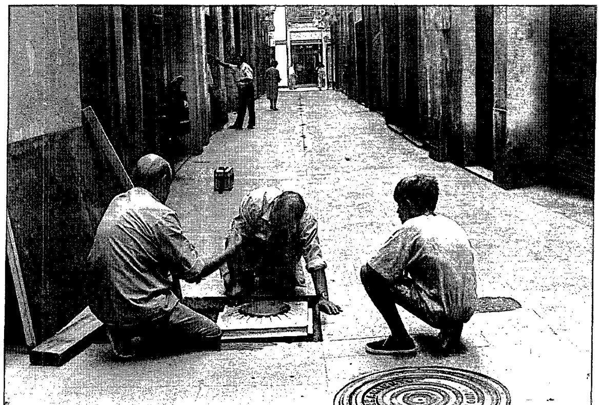
Els operaris es trobaven treballant divendres al matí a la instal·lació de les pilones.

D'altra banda, aquesta setmana l'Ajuntament de Girona va anunciar que a finals d'any té previst instal·lar al principi del carrer de la