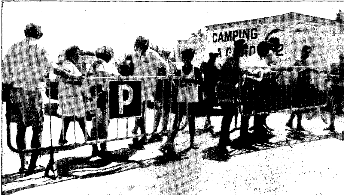
Un grup d'estiuejants en el moment de retirar les tanques que havia instal·lat l'Ajuntament de Sant Pere Pescador per impedir l'accés de vehicles a la platja si no pagaven 200 pessetes.

El primer dia que es va intentar posar en marxa aquest sistema, dissabte passat, ja es van produir incidents. El regidor de turisme ha ex-