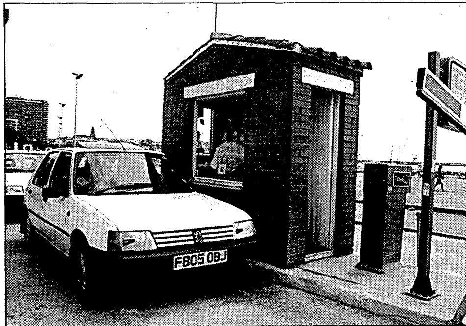
Els diferents aparcaments que hi ha a les poblacions de la Costa Brava es troben aquest mes d'agost totalment plens. (Fotos MARÇAL MOLAS).