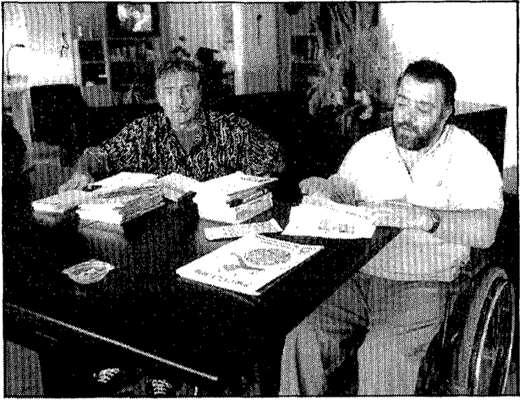
La gent discapacitada demana més accions positives (Foto J. PICAZO).