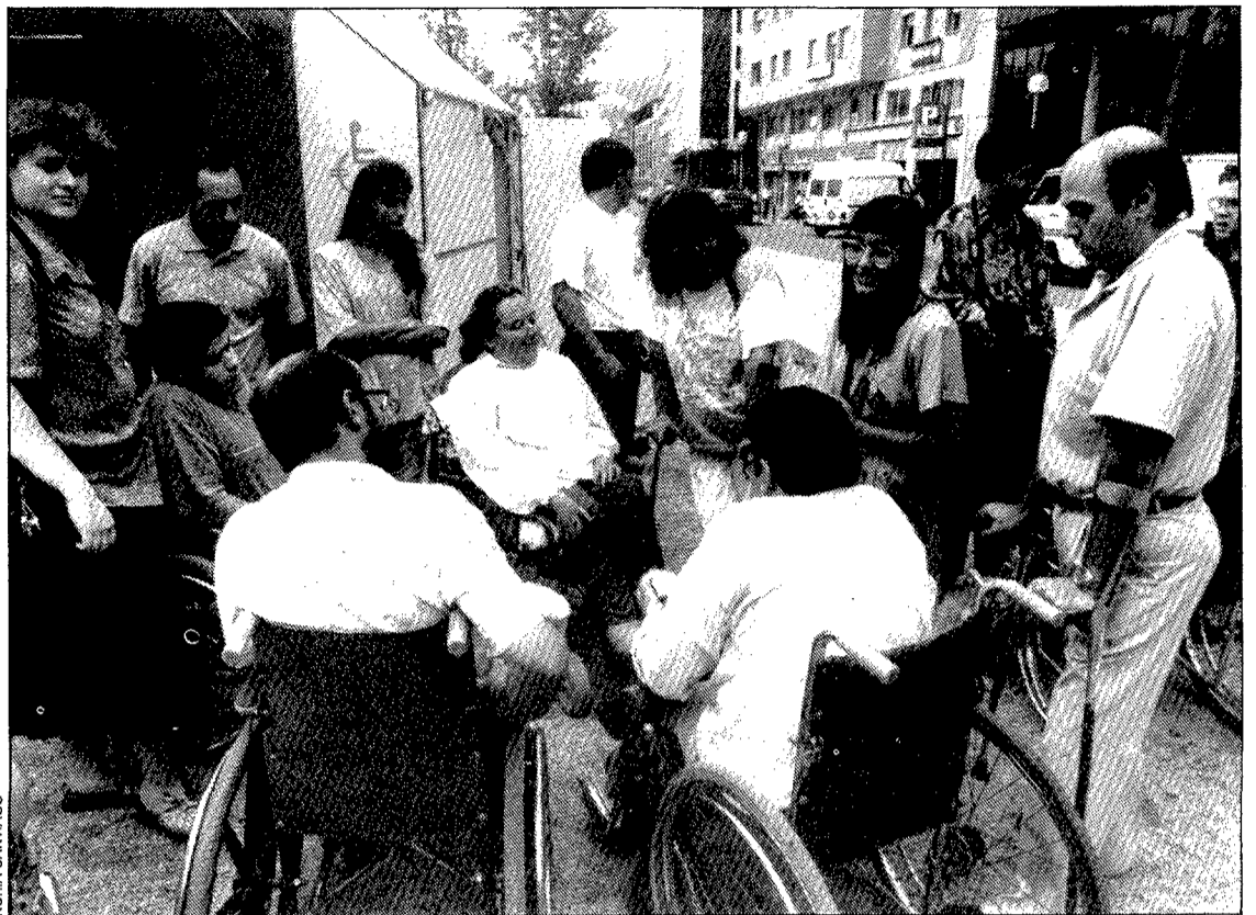
Un moment de la concentració d'ahir a la plaça de la Constitució.