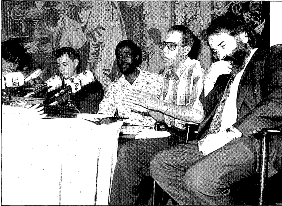
Un moment de la presentació de l'Informe de Girona, que es va fer el mes de juliol passat.