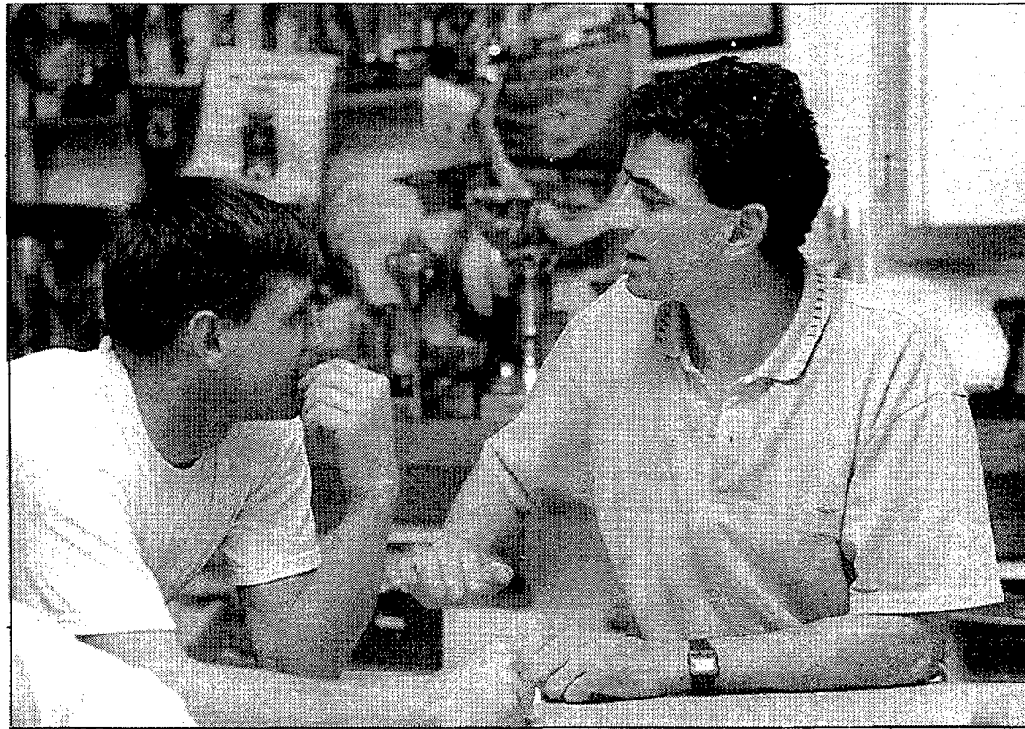
Picón vol que tothom doni el màxim en aquesta recta final.

«Si no estirem tots del carro, al final tindrem el que ens mereixem»