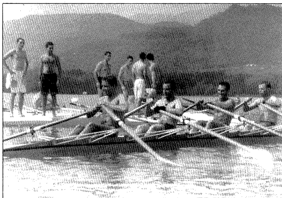
Els soldats van practicar rem i piragüisme a l'Estany.

brar un campionat de tennis de taula, en què van prendre part quaranta-set persones. Els actes de la Festa Major de Sant Jaume de Llierca es van cloure diumenge amb un ball amenitzat pel conjunt Setson i Blas. / TONI SELLAS