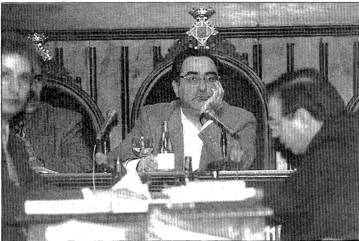
Nadal ja va anunciar a l'estiu que el pressupost de 1994 serà de contenció.

Aquestes fonts també van manifestar que l'equip de govern «podria mantenir alguna