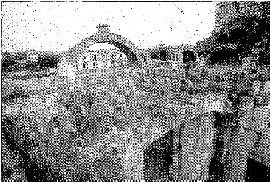
Panoràmica dels patis interiors del castell de Sant Ferran.

L'enorme inversió que suposarà dur a terme qualsevol iniciativa en aquest immens recinte fortificat, de 215.000 metres quadrats i cinc quilòmetres de perímetre, fa encara més difícil que algú es faci càrrec de la seva gestió. De totes maneres, el Ministeri confia