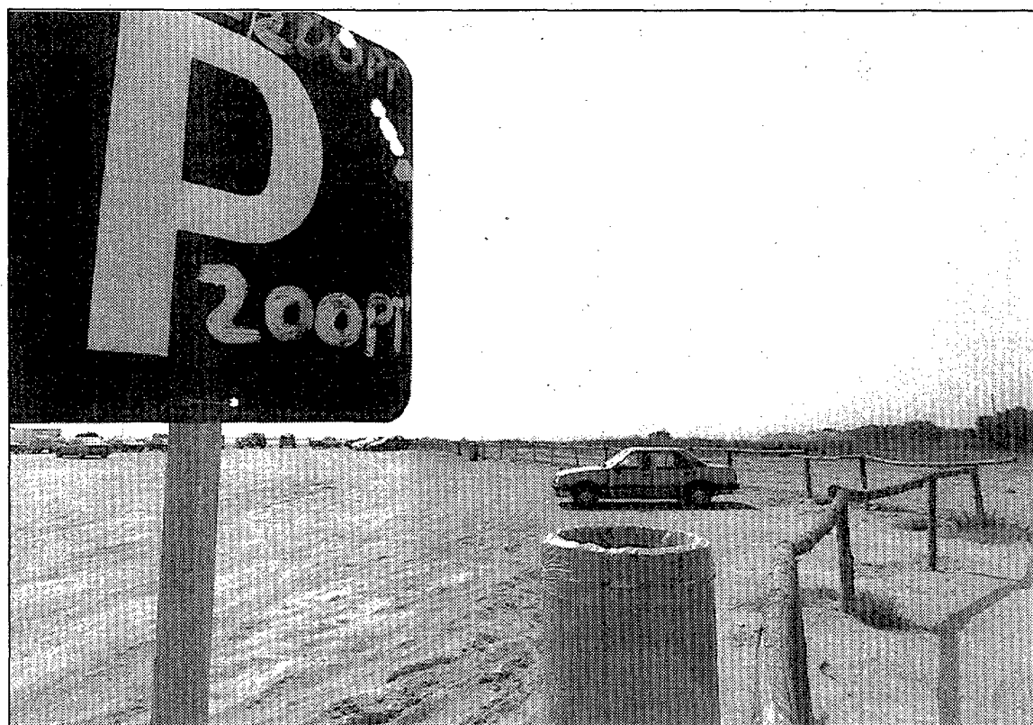
Un dels aparcaments de pagament de la platja de Sant Pere Pescador.

La consolidació dels quatre aparcaments de pagament ha comportat que es millorin els accessos a la platja de Sant Pere, de manera que s'ha eliminat la rasa que l'any passat impedia anar amb cotxe fins a