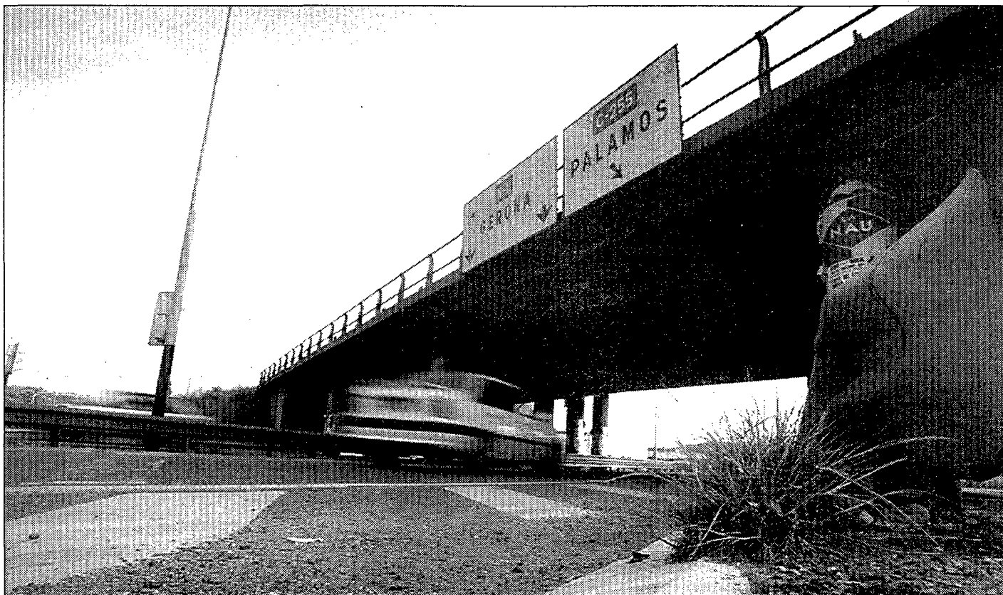
L'Ajuntament i entitats de Sarrià han creat una comissió per denunciar el retard en la decisió sobre els antics accessos a la A-7.