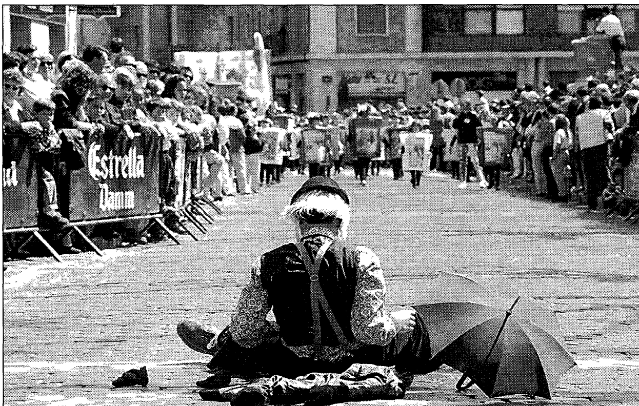
Un pallaso de Tramunteatre, enmig de la desfilada.

Un grup de nens i nenes disfressats de conte formaven la carrossa guanyadora del concurs, Fantasia dels contes . La que va guanyar el segon premi, titulada Les fires , representava per mitjà de disfresses les fires que tenen lloc a Figueres durant les Festes de la Santa Creu. Nens amb capgrossos simbolitzaven la fira del dibuix, les parades ambulants, la mostra d'artesanía, i nens i nenes disfressats de tractor representaven la fira comercial. Entre la comitiva hi havia també alguns segells i diverses monedes. La carrossa de Mifas, amb el títol d' Integració del minusvàlid , que va rebre el tercer premi,