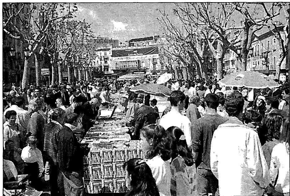
Els segells van despertar l'interès de col·leccionistes i del públic en general.

Posteriorment, també a l'Embarracà't, es va celebrar un campionat de parxís organitzat pel Centre Excursionista Empordanès. A les deu de la nit va actuar al mateix espai el grup Quartetto de Cinque i després ho va fer el grup Halley.