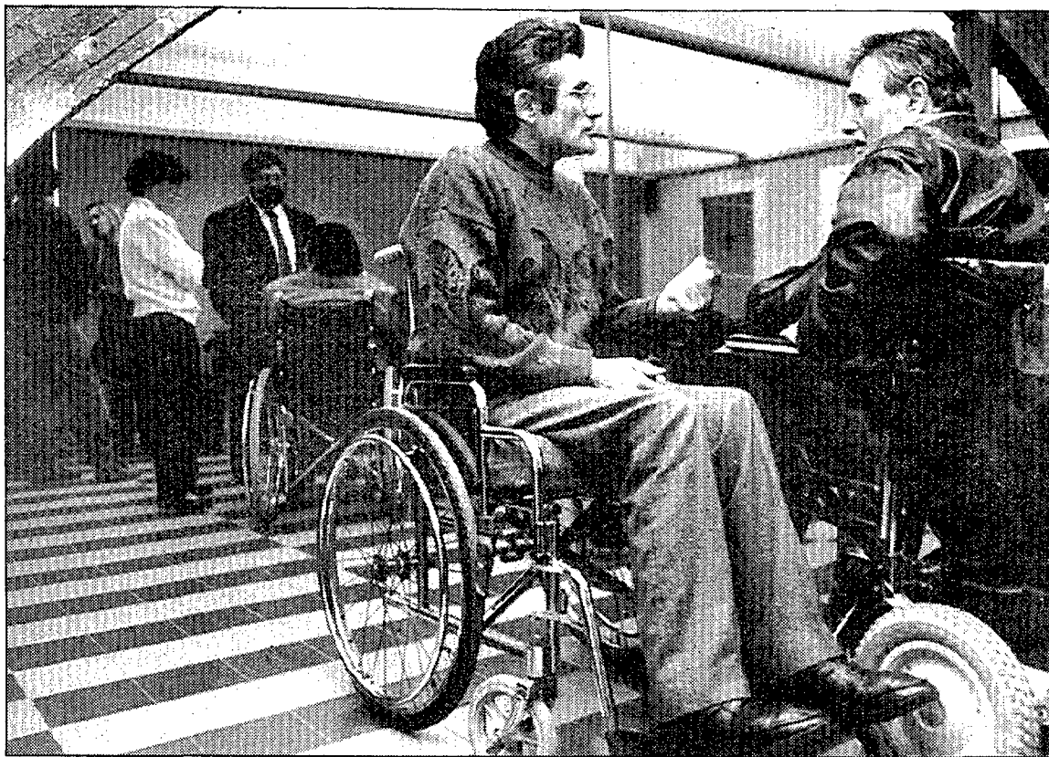
Acció Directa recull divers material ortopèdic per prestar.

El material que accepta l'associació és de tot tipus: cadira de rodes, croses, caminadors, llits hospitalaris. «Des del setembre intentem fer de pont entre aquells que, per circumstàncies de la vida, necessiten aquest tipus d'aparell temporalment. I si per desgràcia hi ha una persona que ha de necessitar per sempre una cadira de