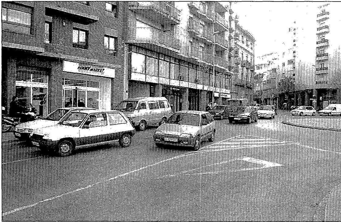
Aspecte que oferia ahir a la tarda el tram del carrer del costat de l'establiment de descompte.