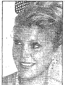
Carmen Cervera, baronessa Thyssen, avui fa 53 anys.