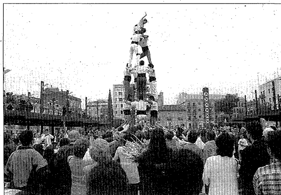
Els Castellans de l'Albera, en un moment de la seva exhibició.

Les activitats van començar a les 11 del matí amb una actuació per a la mainada, i posteriorment hi va haver un audició de sardanes a càrrec del Foment de la Sardana. L'acte que va