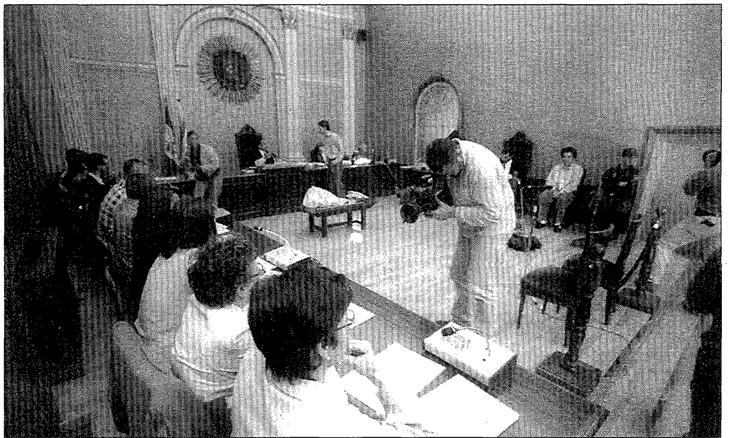
Un càmera de televisió filmant els membres del jurat, moments després que quedés constituït.

■ Els metges afirmen que el jove que va matar la seva mare no n'és responsable