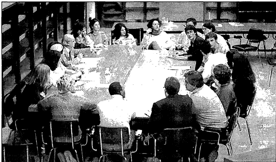
Els joves van decidir tancar-se ahir a la nit a la Universitat de Girona.

Les entitats han redactat un manifest en què es demana que es creïn d'àrees de seguretat, que es convoqui una conferència internacional amb el líders regionals, i que es decreti immediatament l'embargament d'armes. L'objec-