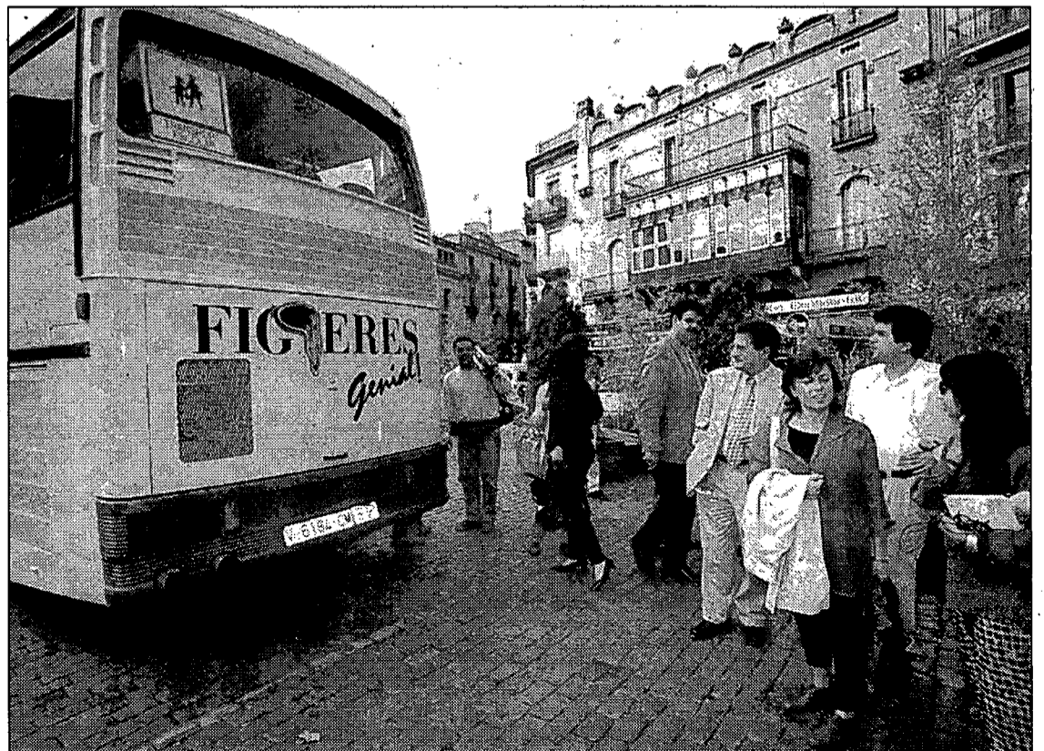
L'autobús que entrarà en servei el mes de gener serà idèntic al que s'utilitza com a transport escolar.

Mifàs ha criticat l'actitud de l'Ajuntament en comprar un autobús vell —té 14 anys d'antiguitat— que l'Ajuntament de Barcelona «s'ha tret de sobre perquè la llei de promoció de l'accessibilitat que determina la Generalitat els obliga a adaptar-los». El portaveu de Mifàs, Quim Martínez, ha manifestat que l'Ajuntament, després de citar-los a deu reunions per consensuar el servei de transport públic, no ha tingut en compte les necessitats de les persones amb discapacitats físiques. Mifàs té previst intervenir en el ple de demà passat on s'ha de ratificar l'acord de transferèn-