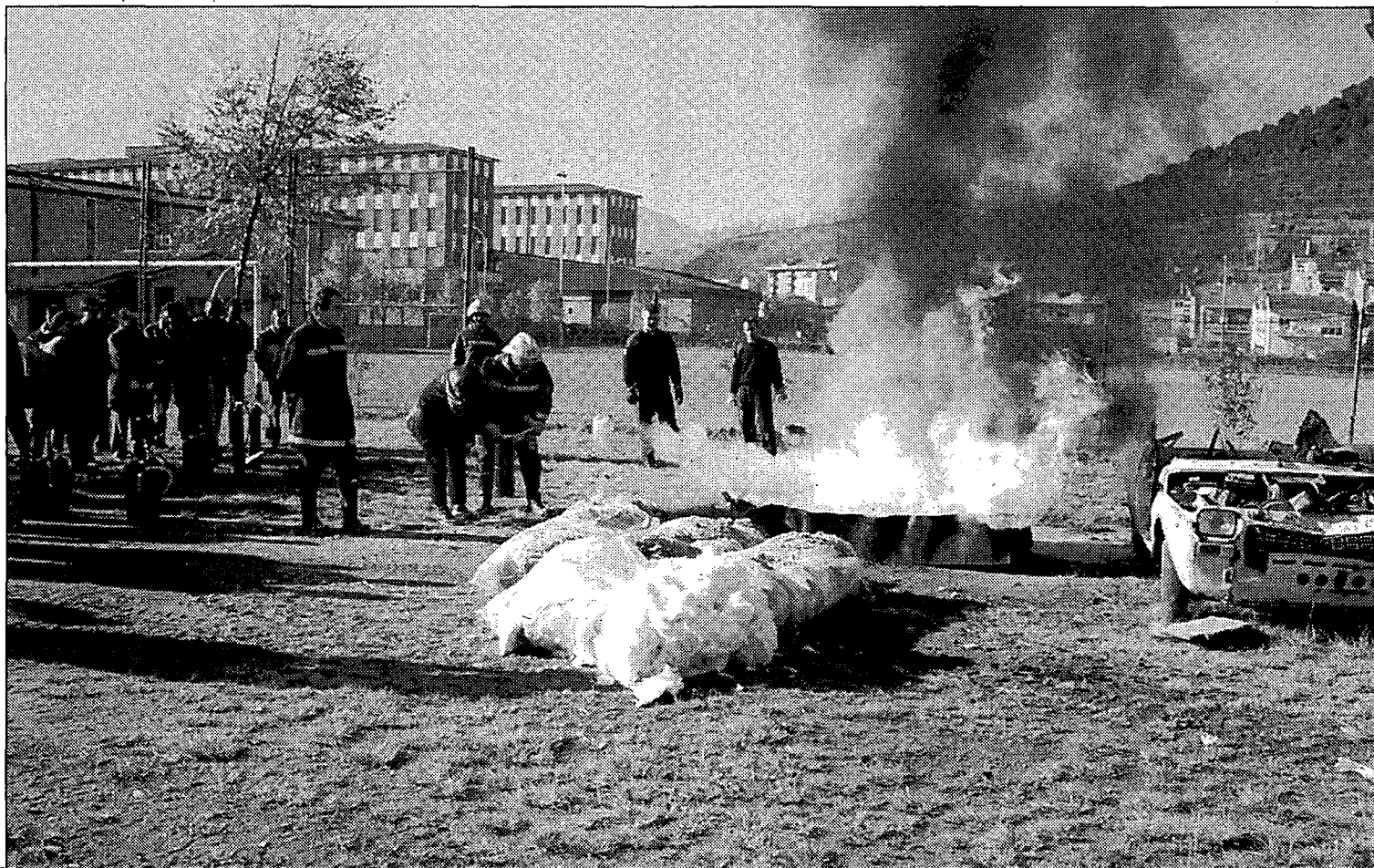
Els treballadors ahir, mentre rebien les classes sobre com apagar un foc.

Saber actuar amb calma i rapidesa davant la detecció d'un incendi pot significar salvar la vida per a una empresa del fil, un dels sectors productius que més pateixen les conseqüències d'aquest tipus de sinistres. Amb aquest objectiu, el grup Hilosa i Salafil d'Olot va organitzar ahir, amb la col·laboració de l'empresa Seremex i el cos de bombers de la Generalitat, un curs ràpid d'extinció d'incendis entre els seus treballadors.