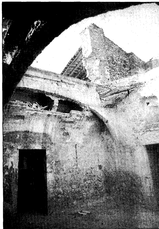
A l'esquerra una sala que s'ha començat a endreçar i a la dreta una de les arcades d'una estança de l'edifici.

veure les barraques metàl·liques que es van cedir com a habitatges a la comunitat gitana després de l'operació neteja que es va fer al barri ara fa tretze anys.