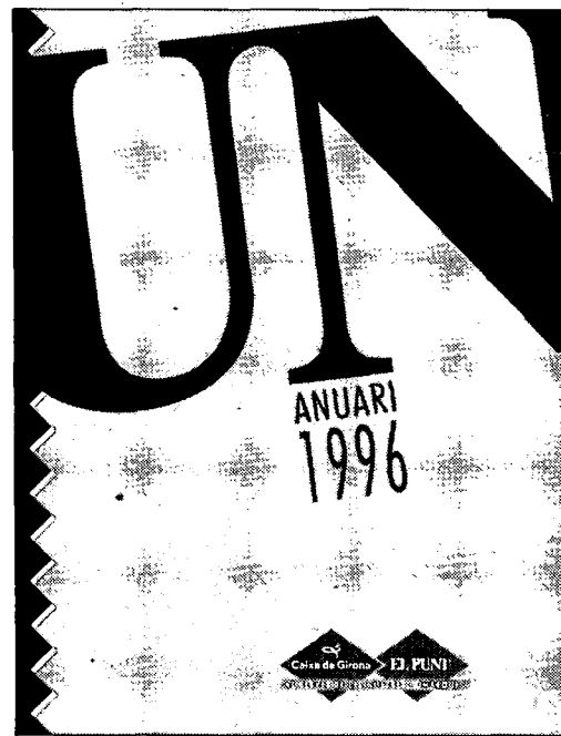
«Anuari 96». Les comarques gironines en dades. Tot allò que us cal saber de cada municipi i tots els resultats esportius

Els tres llibres, «Quina por!», «El nus» i l'Anuari 96, es venen només de forma conjunta al preu de 1.200 ptes.