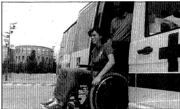
Les dificultats de les persones amb mobilitat reduïda són moltes.

L'experiència va servir per conscienciar els ciutadans que els carrers són de tots i que per tant, un descuit o un acte d'incivisme pot perjudicar greument a la resta. Les portes obertes de vehicles o furgonetes causen molts dels accidents urbans que pateixen les persones cegues.