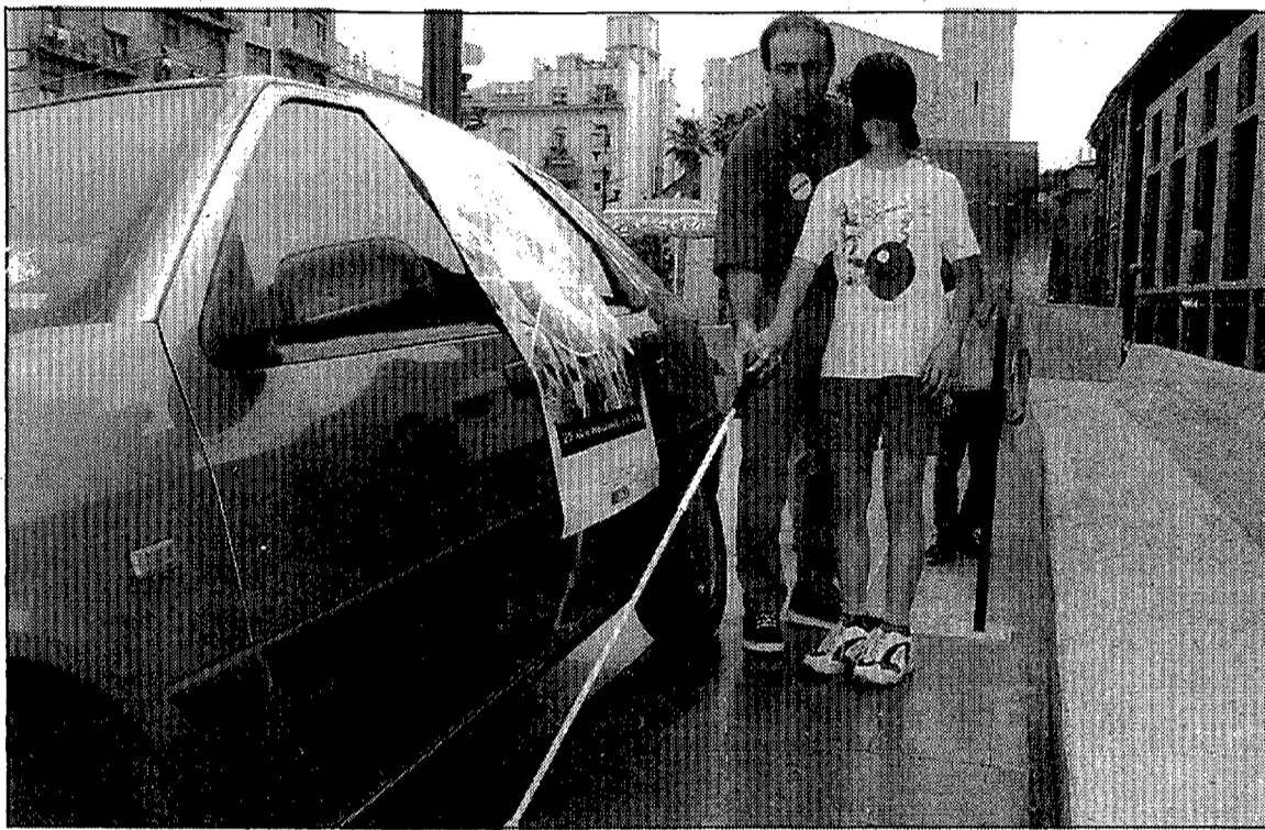
Els participants van haver de realitzar el circuit amb els ulls tapats.

Tots ells anaven amb els ulls tapats, acompanyats per tècnics i membres de la Jove Cambra que els explicaven com havien d'usar el bastó, i de quina