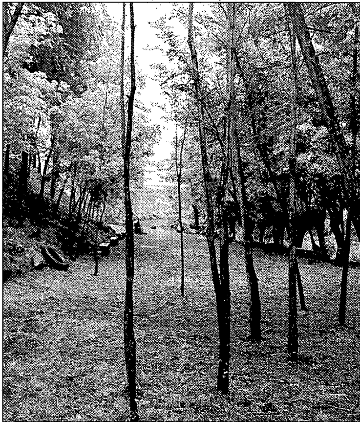
La nova zona fluvial del carrer Zamenhof s'inaugurarà dissabte.

● Noves zones verdes Demà, dissabte, s'inaugurarà la restaurada zona fluvial del carrer Zamenhof, on s'han adequat uns 2.000 metres quadrats de terreny per convertir-lo en zona d'esbarjo. S'han instal·lat bancs al llarg del recorregut, i també s'hi han instal·lat diversos níus d'ocells per tal de repoblar la zona amb espècies autòctones. Vizern va avançar ahir que el consistori té la intenció d'ampliar aquesta zona construint un passeig entre els molins d'en Climent i de la Torre. El condicionament de la zona