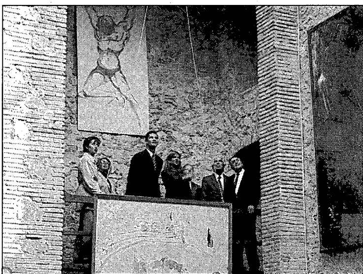
A dalt, els ducs de Palma de Mallorca, a l'arribada a la casa daliniana de Portlligat. A sota, la infanta Cristina i Iñaki Urdangarin al Museu Dalí de Figueres.

de corbata de disseny dalinià, el Llibre del pa i un catàleg del museu. La infanta i el seu marit