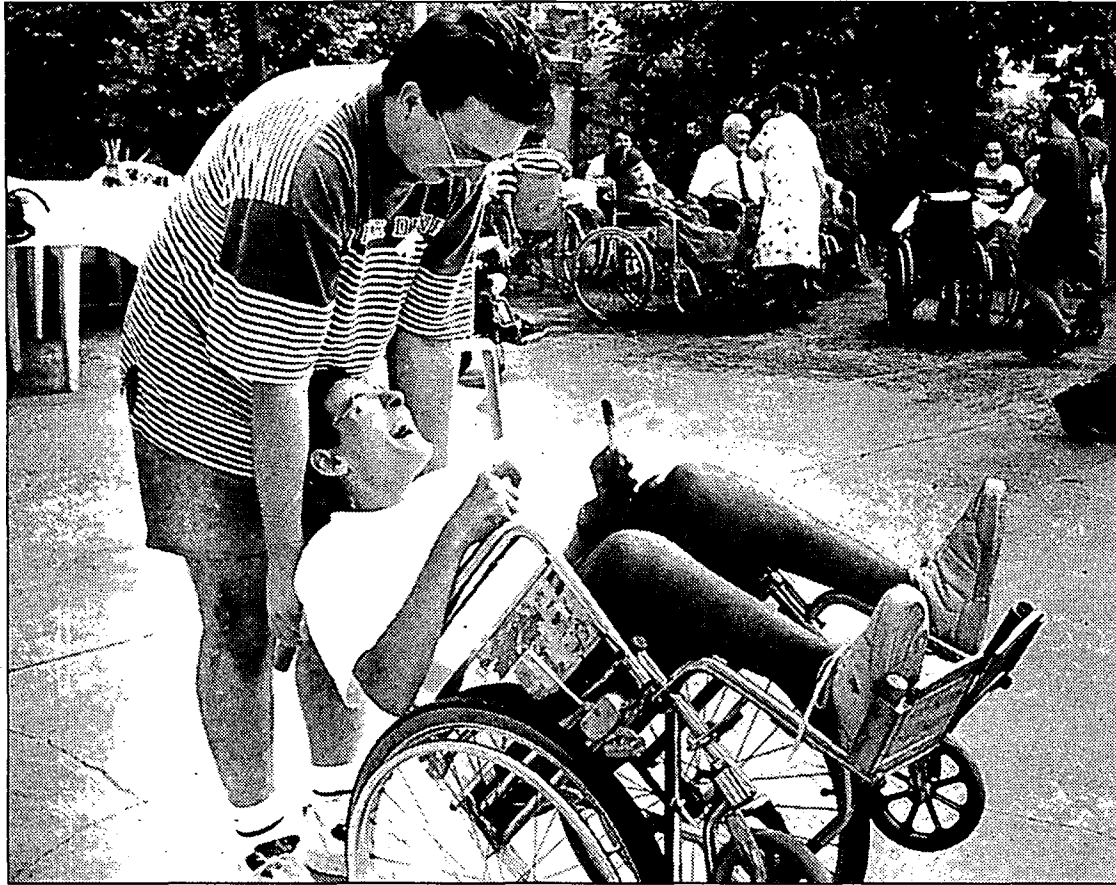
Un voluntari amb un discapacitat, en una imatge extreta d'un llibre de MIFAS.