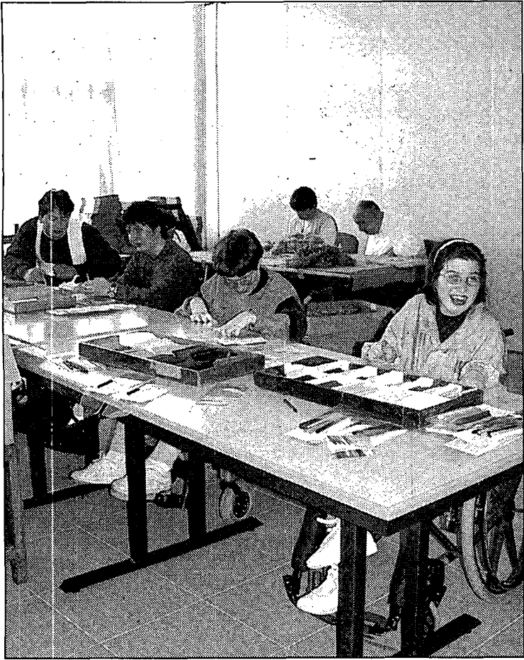
Els minusvàlids fent alguns treballs al nou centre de Riudellots.