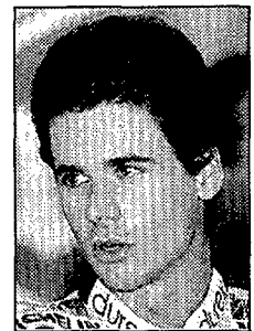
Alex Crivillé, pilot de motociclisme, avui fa 28 anys.