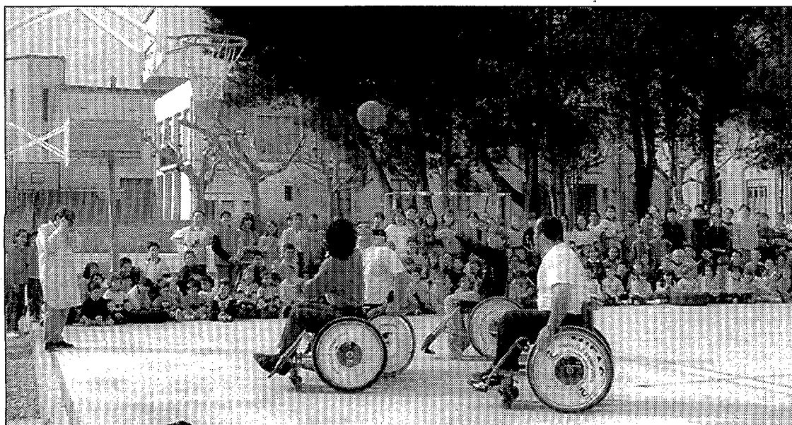
Les activitats es van portar a terme durant tota la setmana passada.

■ Figueres.— Un total de 450 alumnes de l'escola Josep Pallach de Figueres han participat en una sèrie d'activitats per prendre consciència i sensibilitzar-se de les dificultats que tenen les persones amb disminució física i sensorial. Els exercicis, organitzats per l'àrea d'Educació Física, han consistit en uns jocs i esports adaptats a diferents tipus de minusvalideses i en un partit de bàquet amb cadira de rodes. En total, hi han col·laborat els 25 mestres de l'escola i l'associació Mifas de l'Alt Empordà. /EL PUNT