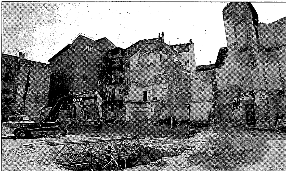
Les màquines han començat a excavar el forat on es construirà l'aparcament soterrani.