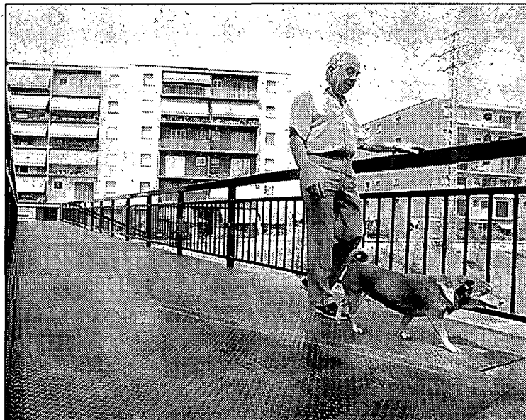
Un veí passa amb el seu gos pel pont nou.

Girona. — El pont de l'Àngel, que uneix el barri de Sant Narcís amb el de Can Gibert del Pla ha estat totalment renovat. El nou pont, que és molt semblant al que hi havia anteriorment i ocupa exactament al mateix lloc, ha suposat una inversió de tres milions i mig de pessetes i presenta, com a principal novetat, un paviment no lliscant que substitueix les antigues lloses. Precisament el paviment lliscant que hi havia abans havia provocat les repetides queixes dels veïns de la zona que utilitzen aquest itinerari. /C.R.