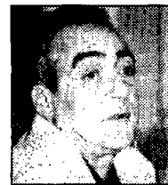
JUAN JOSÉ MILLÁS

El que és fotut és que moltes vegades la gent de dretes volen ser-ho i no volen semblar-ho i la gent d'esquerres gallegen de semblar-ho abans de ser-ho.