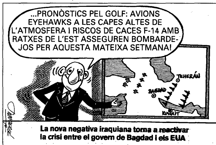
La nova negativa iraquiana torna a reactivar la crisi entre el govern de Bagdad i els EUA