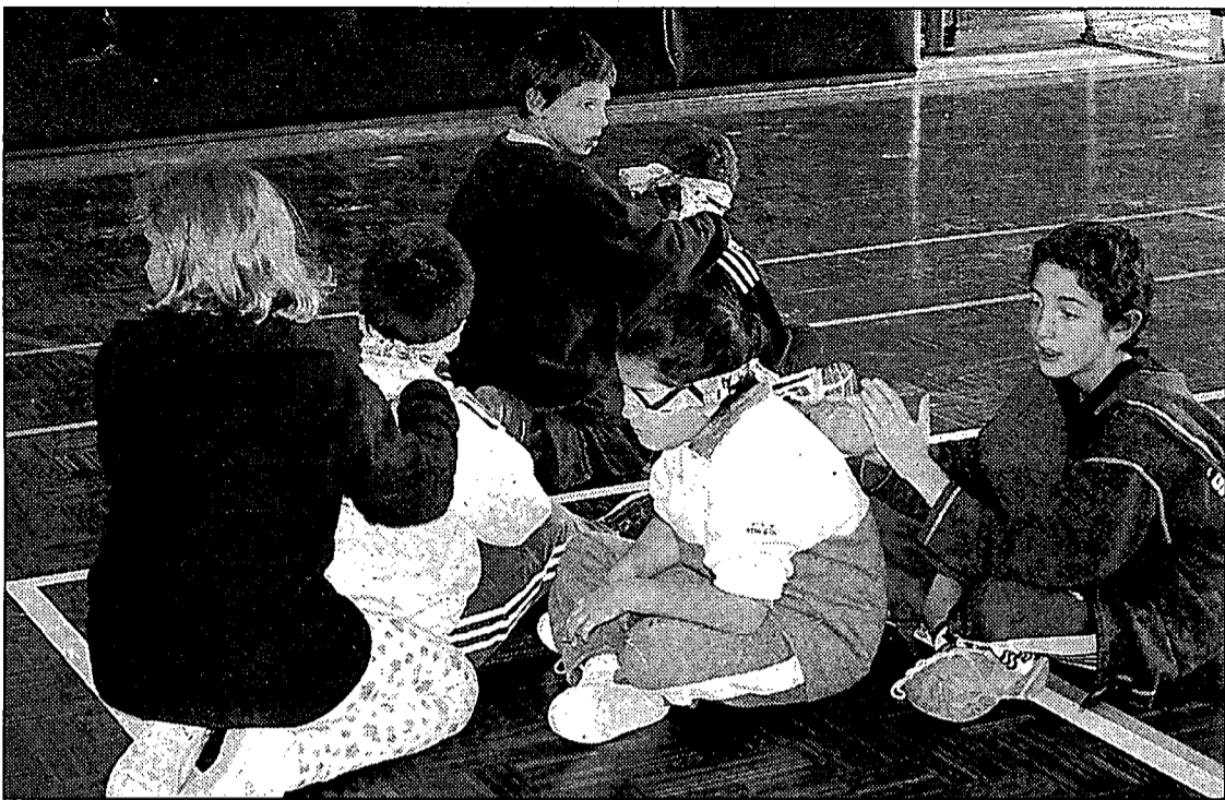
Nens i nenes jugant, ahir al matí, al pavelló de Figueres.