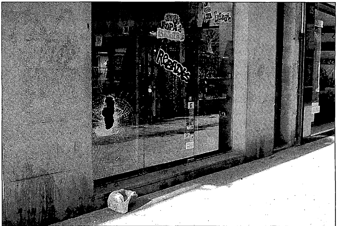
L'aparador de la botiga Savuka, al carrer Argenteria, i el tros de runa utilitzat per trencar-ne el vidre.

Maldonado ha denunciat els robatoris, però també reclama que l'Ajuntament elimini la possibilitat que l'incident es repeteixi. Més botiguers del carrer s'afegeixen a la petició. A la llibreria Geli, es queixen que van avisar la Policia Municipal perquè fes retirar el contenidor de runa i no ho va fer. «Ja ho sabia, jo,