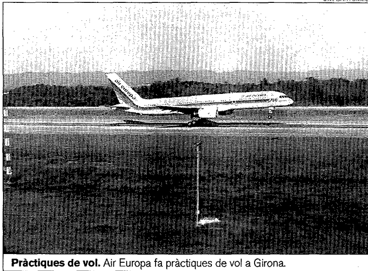
Pràctiques de vol. Air Europa fa pràctiques de vol a Girona.

Fonts de la Diputació han informat que «hem mantingut converses amb directius de la companyia Air Europa, que s'ha compromès a fer un estudi de viabilitat