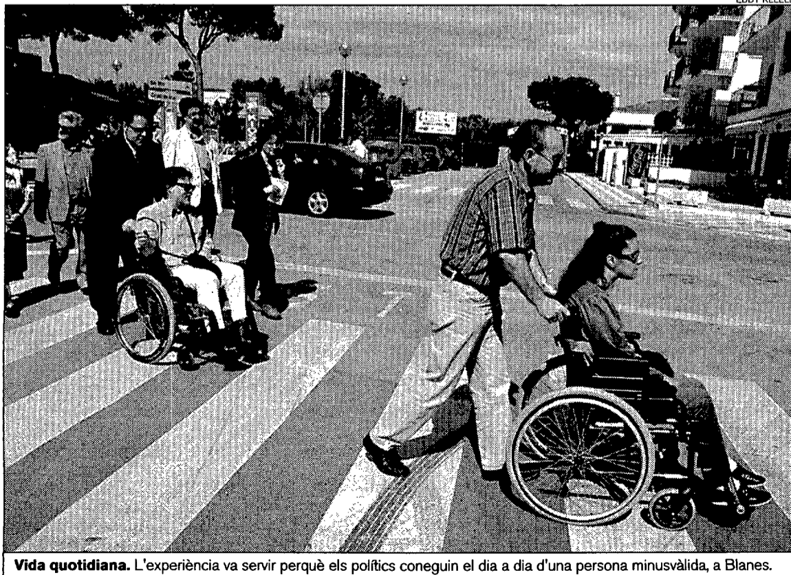
Vida quotidiana. L'experiència va servir perquè els polítics coneguin el dia a dia d'una persona minusvàlida, a Blanes.

Durant la passejada, que va aplegar una dotzena de persones minusvàlides que anaven acompanyades per familiars i membres de l'organització i dels polítics de Blanes, es van repartir uns fullets que portaven el lema Supressió de bar-