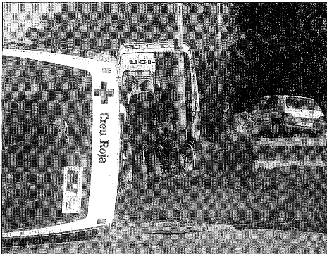
El microbús bolcat ahir a Riudellots, amb alguns dels joves ja a l'exterior.

quatre ocupants del cotxe, un Seat Ibiza amb matrícula de Barcelona, van haver de ser ingressats amb ferides greus. L'accident va obligar a mantenir tallats dos dels tres carrils de l'A-7 en aquest punt fins a les cinc de la tarda, quan es va poder retirar el camió. Es dona la circumstància que en l'altre accident que hi va haver ahir a l'A-7, pels volts de dos quarts de set del matí, també s'hi va veure implicat un camió carregat de taronges. El vehicle va sortir de l'autopista a l'altura de Maçanet