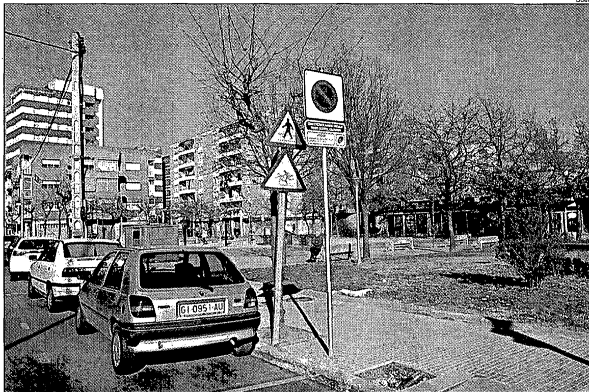
Zones blaves. Abans de final de mes entraran en vigor els nous preus de Salt i es col·locaran nous parquímetres.

El termini d'exposició pública dels nous preus es va esgotar divendres i ahir l'Ajuntament va començar els tràmits necessaris per-