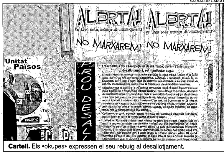
Cartell. Els «okupes» expressen el seu rebuig al desallotjament.

Aquests fullets s'afegeixen als que van penjar la setmana passada amb el lema «Resistirem. Les Tines en perill». A l'antic magatzem de vins de la ronda Ferran Puig on estan instal·lats també hi ha aparegut una pancarta de rebuig al desallotjament.